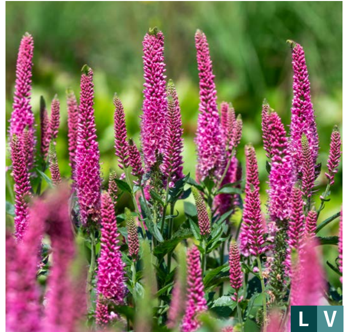
75181 | Lansita Pink Veronica hybrida VI:VII →20 |25/35 ☀️ ❄️ 5 🌿