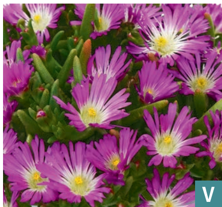
71985 | Solstice Purple Delosperma cooperi V:VII →25 |8/10 ☀️ ❄️ 7 🌿