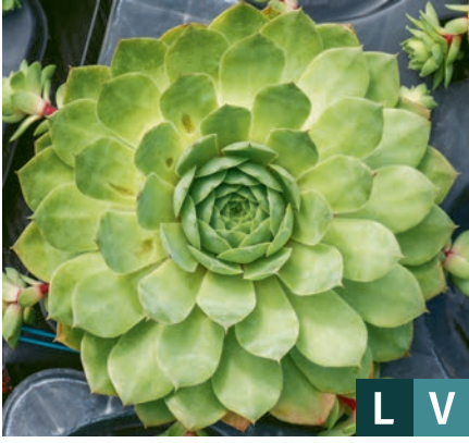
76123 | BigSam™ Jumbo Green Sempervivum hybrida VI:VII →15 |25/30 ☀️ ❄️ 5