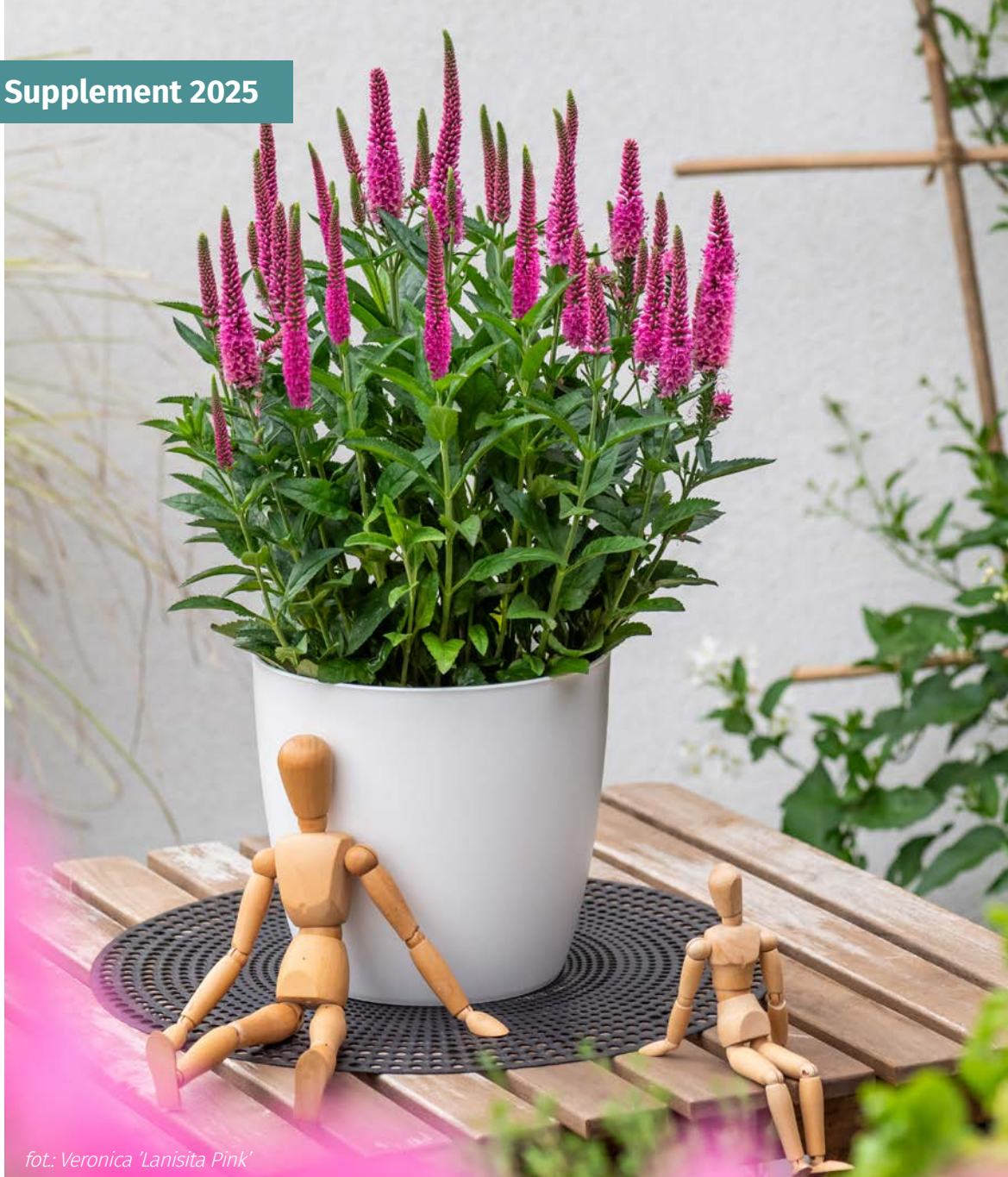
fot.: Veronica 'Lanisia Pink'