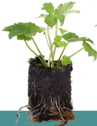
T-84 Swift Plug

PL | Zimowane byliny, krzewy i trawy do szybkiej sprzedaży DE | Überwinterte Stauden, Sträucher und Gräser für den schnellen Verkauf NL | Overblijvende vaste planten, struiken en grassen voor snelle verkoop FR | Vivaces, arbustes et graminées hivernés en vente rapide RU | Перезимовавшие многолетники, кустарники и травы для быстрой продажи