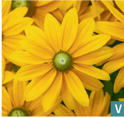
76441 | Kick-Start Passion Rudbeckia hirta VI:X --35 |40/45 ☀️ ❄️ 7 🌱