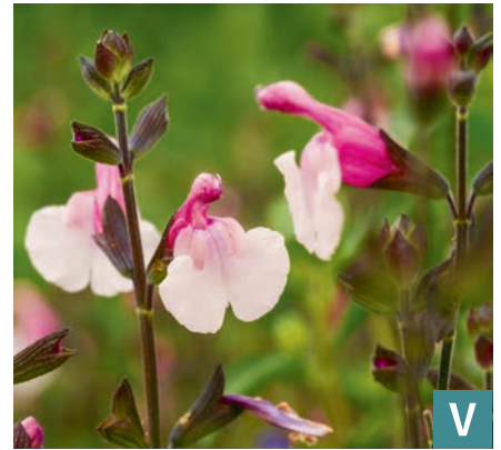
78264 | Dancing Dolls Salvia gregii VI:X --40 |40/60 ☀️ ❄️ 7 🌱 🌿