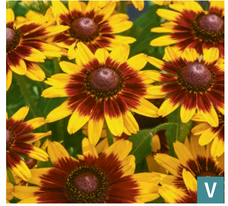
76436 | Littlebeckia™ Step Up Rudbeckia hirta VI:X --20 |35/40 ☀️ ❄️ 7 🌱