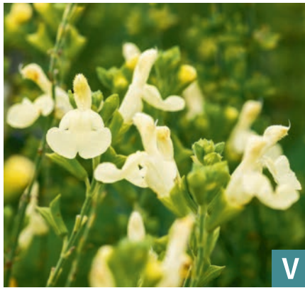
78267 | Lemon Light Salvia gregii VI:X --30 |35/50 ☀️ ❄️ 7 🌱 🌿