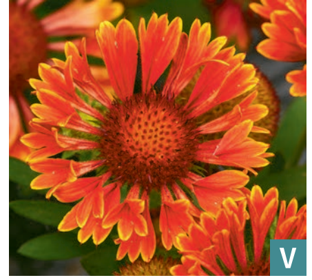
74946 | SpinTop™ Mariachi Red Sky Gaillardia aristata VI:IX →35 |30/35 ☀️ 🌿 7 🌿 🌿