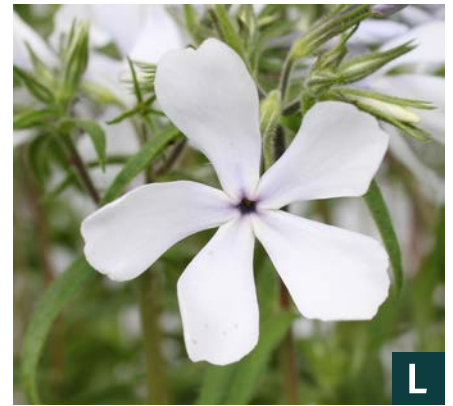
76391 | White Perfume Phlox divaricata IV:VII →40 |20/30 ☀️ 🌿 5 🌿