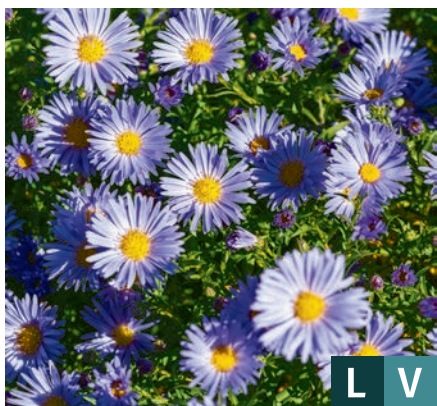
74026 | Mittelmeer Aster dumosus VIII:X →30 |25/30 ☀️ ❄️ 4 🌿