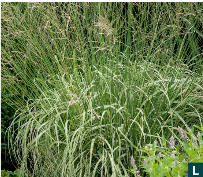
77671 Mostenveld Molinia arundinacea VIII: X —50 | 30/80 ❄️ ☀️ 5