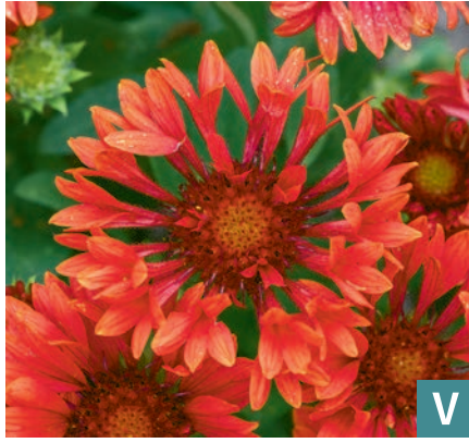
76495 | SpinTop™ Mariachi Red Gaillardia aristata VI:IX →35 |30/35 ☀️ 🌿 7 🌿 🌿