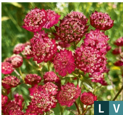
71622 | Red Button Astrantia major VI:VIII →40 |30/60 ☀️/❄️ ❄️ 5 🌿