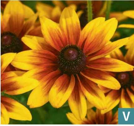
76442 | Kick-Start Kissing Rudbeckia hirta VI:X --35 |40/45 ☀️ ❄️ 7 🌱