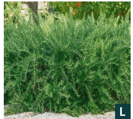
79772 | Prostratus Rosmarinus officinalis VI:VIII →50 |20/20 ☀️ 🌿 7 🌿 🌿