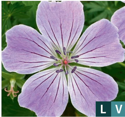
71150 | Frivolius Lilac Geranium sanguineum VI:VII →30 |15/20 ☀️ 🌿 4 🌿