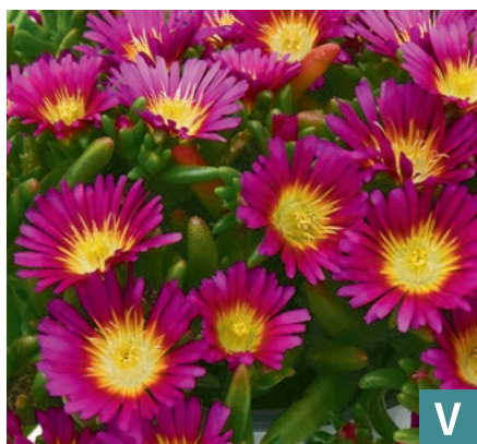
71982 | Solstice Purple Bicolour Delosperma cooperi V:VII →25 |8/10 ☀️ ❄️ 7 🌿