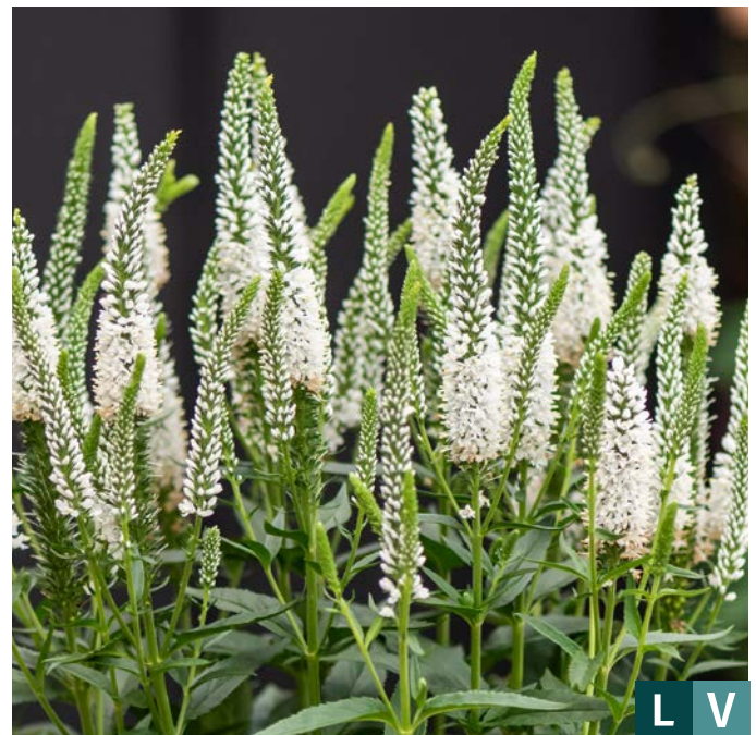
75182 | Lansita White Veronica hybrida VI:VII →25 |25/30 ☀️ ❄️ 5 🌿