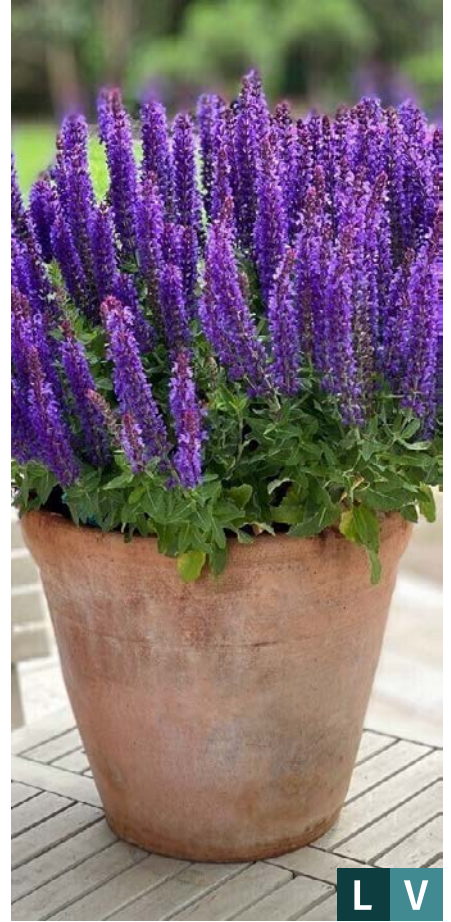
77381 | Rianne Purple Salvia nemorosa V:VI --30 |25/30 ☀️ ❄️ 5 🌱 🌿