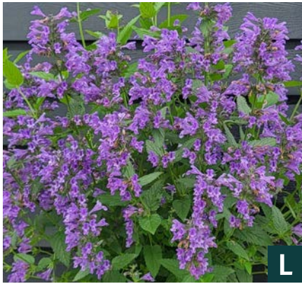
74943 | Weinheim Big Blue Nepeta hybrida VI:IX →40 |40/50 ☀️ 🌿 4 🌿