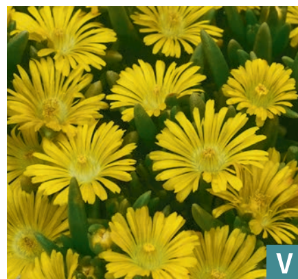
71983 | Solstice Yellow Delosperma cooperi V:VII →25 |8/10 ☀️ ❄️ 7 🌿