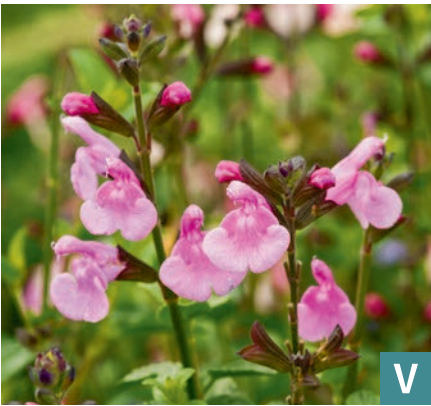
77382 | Flower Child Salvia gregii VI:X --40 |40/60 ☀️ ❄️ 7 🌱 🌿