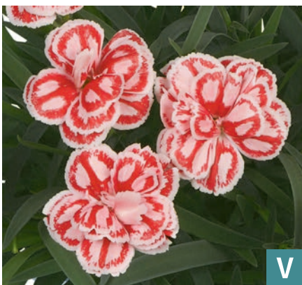
77891 | Raspberry Eyes Dianthus hybrida V:VI →20 |15/25 ☀️ ❄️ 5