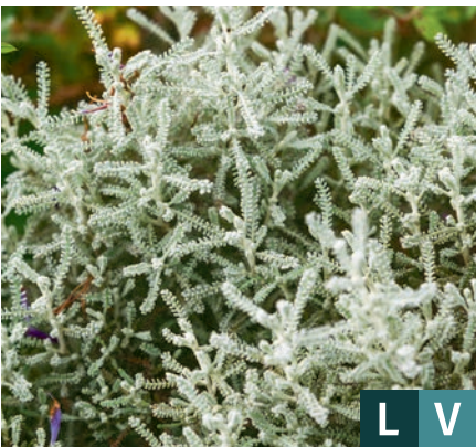
70522 | Lambrook Silver Santolina chamaecyparissus VII:VIII --30 |20/30 ☀️ ❄️ 6