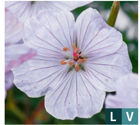
71151 | Frivolius Pink Geranium sanguineum VI:VII →30 |15/20 ☀️ 🌿 4 🌿