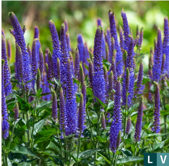
75180 | Lansita Blue Veronica hybrida VI:VII →20 |25/35 ☀️ ❄️ 5 🌿