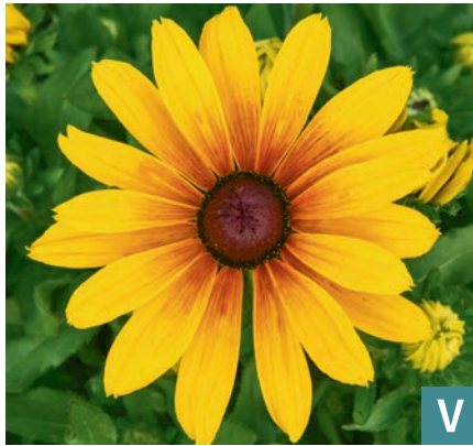
76449 | Sunbeckia® Marilyn Rudbeckia hirta VI:IX --45 |45/50 ☀️ ❄️ 7 🌱