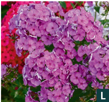
76518 | Lavendelwolke Phlox paniculata VII:IX →50 |70/90 ☀️ 🌿 4 🌿