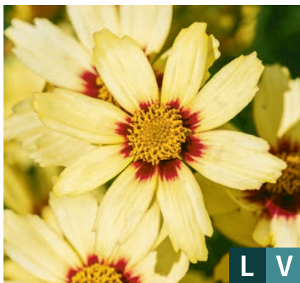
72396 | Redshift Coreopsis grandiflora VII:IX →35 |25/35 ☀️ ❄️ 5 🌿