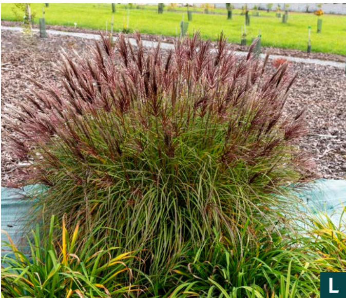
75129 Red Chief Miscanthus sinensis VIII: X —40 | 50/100 ☀️ ❄️ 5