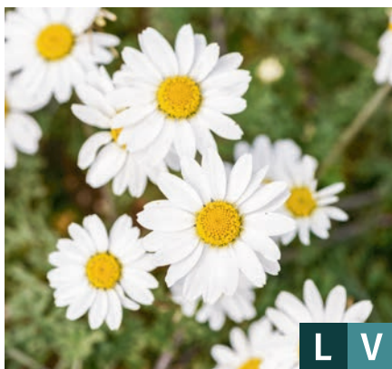
77392 | Karpatenschnee Anthemis carpatia IV:VI →25 |15/25 ☀️ ❄️ 5