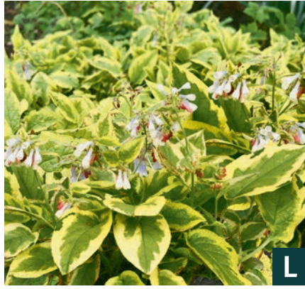
76733 | Goldsmith Symphytum grandiflorum IV:VI →30 |20/30 ☀️/❄️ ❄️ 4