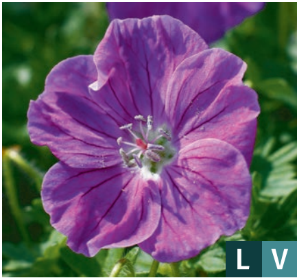
71148 | Frivolius Purple Geranium sanguineum VI:VII →30 |15/20 ☀️ 🌿 4 🌿