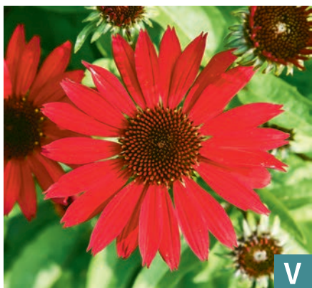
74688 | Pearl Deep Red Echinacea hybrida VI:VII →35 |35/40 ☀️ ❄️ 5 🌿