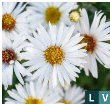
74021 | Niobe Aster hybrida VIII:X →30 |25/30 ☀️ ❄️ 4 🌿