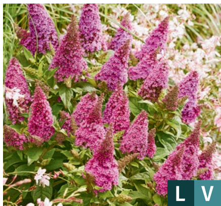
76070 | Butterfly Candy® Little Cerise Buddleja davidii VII:IX →25 |65/65 ☀️ ❄️ 6 🌿