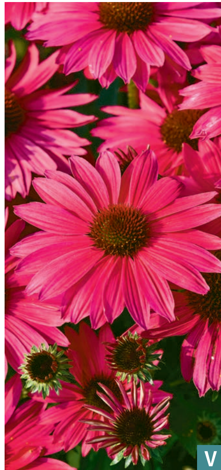
77398 | Pearl Magenta Imp. Echinacea hybrida VI:VII →30 |35/40 ☀️ ❄️ 5 🌿