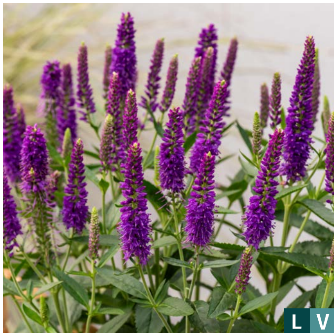
75179 | Lansita Purple Veronica hybrida VI:VII →25 |25/30 ☀️ ❄️ 5 🌿