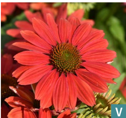
77397 | Pearl Dark Orange Echinacea hybrida VI:VII →30 |30/40 ☀️ ❄️ 5 🌿