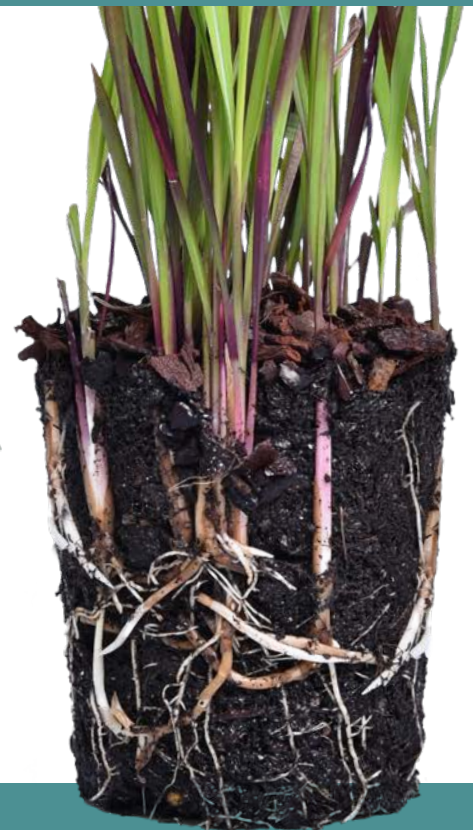
P-9 Swift Plug