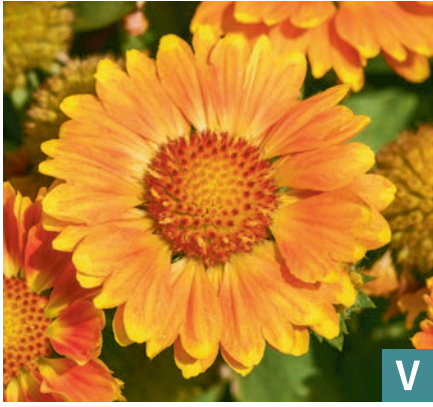
76494 | Gusto Orange Zest Gaillardia hybrida VI:IX →35 |30/35 ☀️ 🌿 7 🌿 🌿