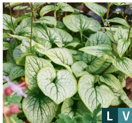
70493 | Little Heart Brunnera macrophylla IV:V →30 |30/40 ☀️/❄️ ❄️ 4