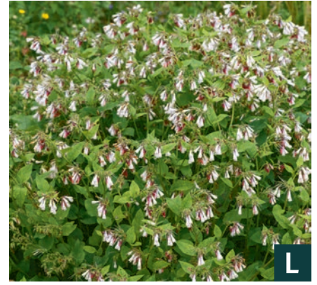
76724 | Hidcote Blue Symphytum grandiflorum IV:VI →30 |20/30 ☀️/❄️ ❄️ 4