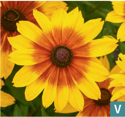
76448 | Sunbeckia® Luna Rudbeckia hirta VI:IX --45 |45/50 ☀️ ❄️ 7 🌱