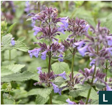
74942 | Bramdean Nepeta grandiflora VI:IX →40 |40/50 ☀️ 🌿 4 🌿