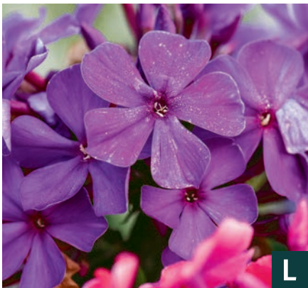
76519 | Düsterlohe Phlox paniculata VII:IX →50 |70/90 ☀️ 🌿 4 🌿