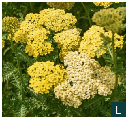
79018 | Credo Achillea hybrida VI:VIII →50 |100/125 ☀️ ❄️ 2 🌿