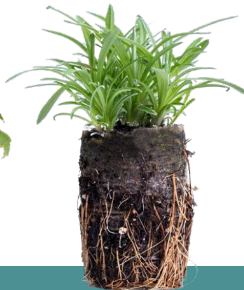
T-40 Swift Plug