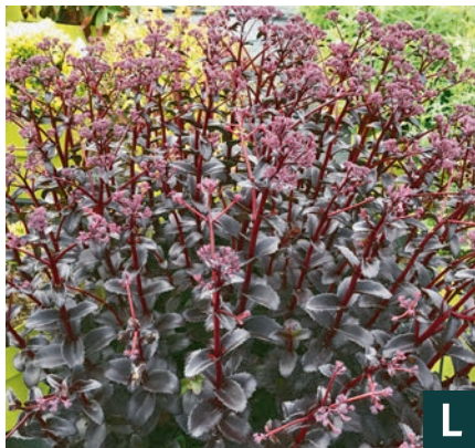
70463 | Black Knight Sedum hybridum VIII:IX --40 |50/60 ☀️ ❄️ 5